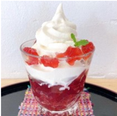
すももクラッシュゼリーのミニパフェ

尾之間温泉の目の前という好立地もあり、地元の皆様・観光客に来店いただき元気に営業しています。メニューも工夫して豊富に提供しています。