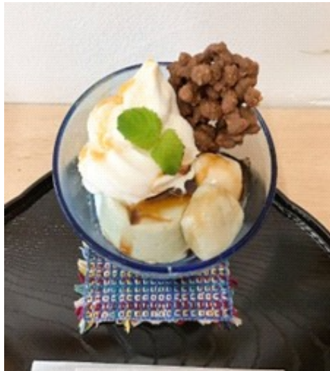
白玉プリンパフェ（期間限定）