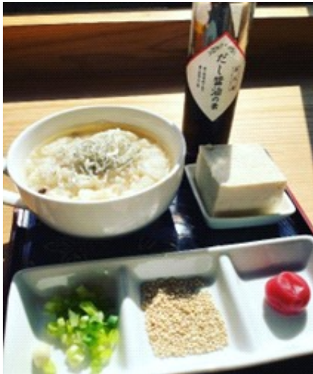
あごだしお茶漬けセット