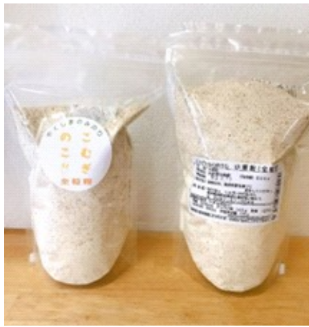
こむぎのこ（全粒粉）