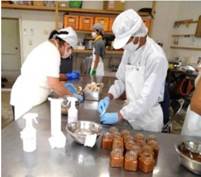
豚味噌をビン詰め 「口をアルコールで丁寧に拭いています」