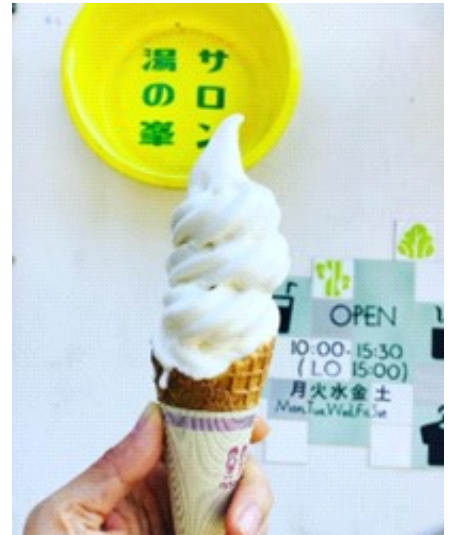
豆乳ソフトクリーム