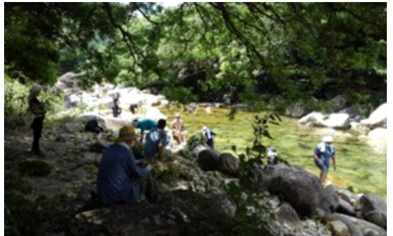
7月遠足 デイリィの川