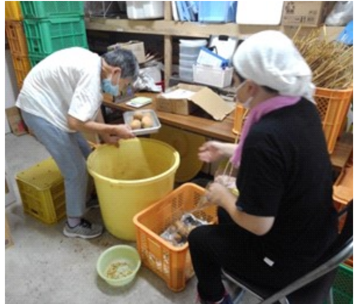
じゃがいもの袋詰め 「重さを揃えるのが難しい」