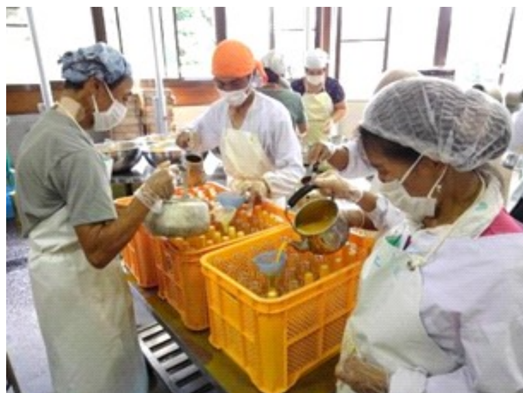
ぽんたん館でビンジュース 「こぼさないように気を付けて！」