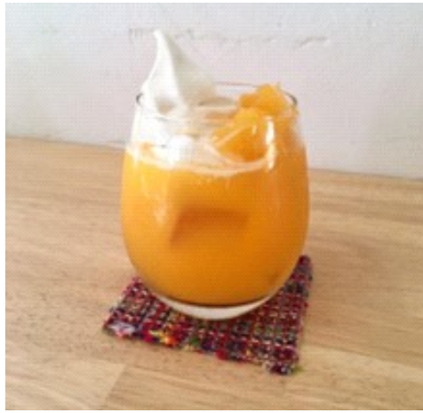
たんかんコロート