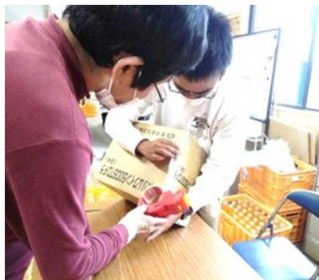
工房でビンジュースの箱詰め 「割れないように慎重に！」