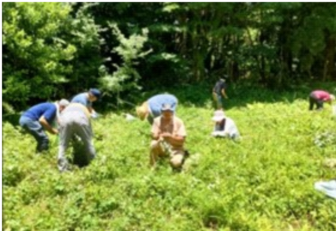
7月遠足 白川山よもぎ摘み