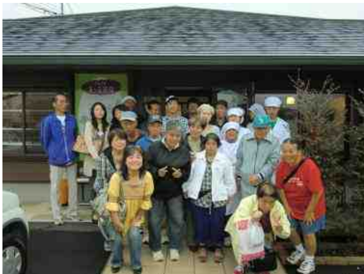
都城「まーる工房」にて