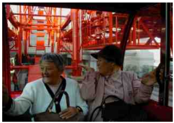
「アミュプラザ」大観覧車にて