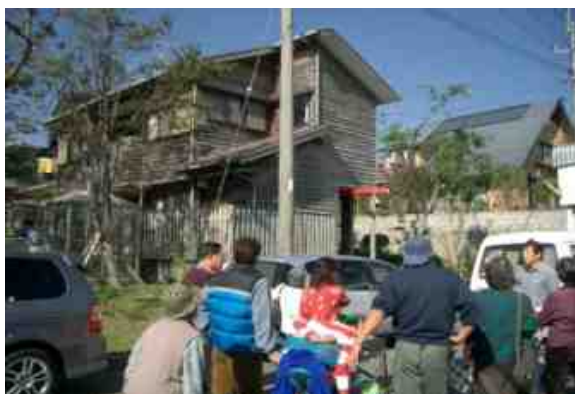
菖蒲学園グループホーム