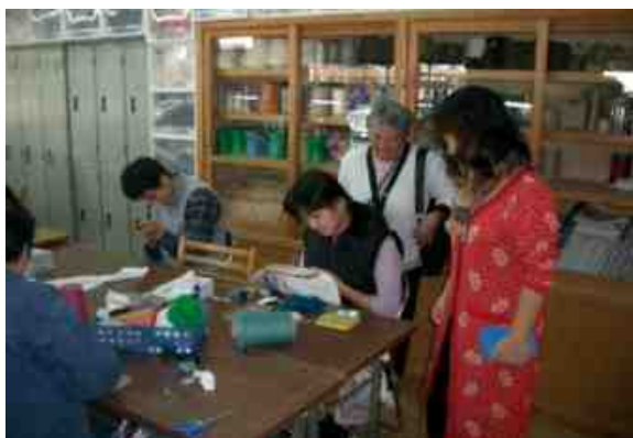
菖蒲学園作業所にて