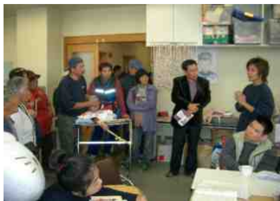
麦の芽いきいきセンター作業所にて